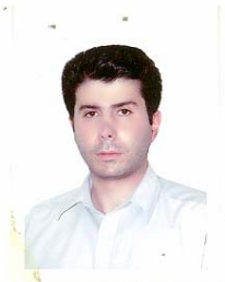
سید محمد جعفر مرتضائی